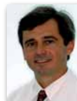
Weber Ursi São José dos Campos - SP