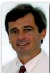
Weber Ursi São José dos Campos - SP