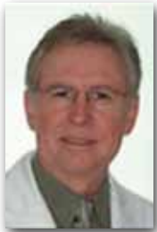
Hugo Trevisi Presidente Prudente - SP