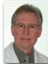
Hugo Trevisi Presidente Prudente - SP